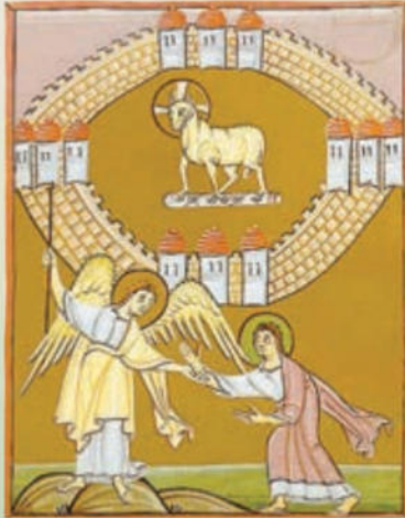
La nuova Gerusalemme (Ap 21,1-27). Immagine tratta dal libro Ja, ich komme bald, Informationszentrum Berufe der Kirche, Friburgo 1985.

La "rivelazione" che questo libro contiene è, infatti, tutta ancorata al linguaggio e ai simboli del culto. Al centro della comunità radunata è Gesù risorto, presentato come l'Agnello immolato che, con la sua offerta sulla croce, ha operato la salvezza di tutta l'umanità.